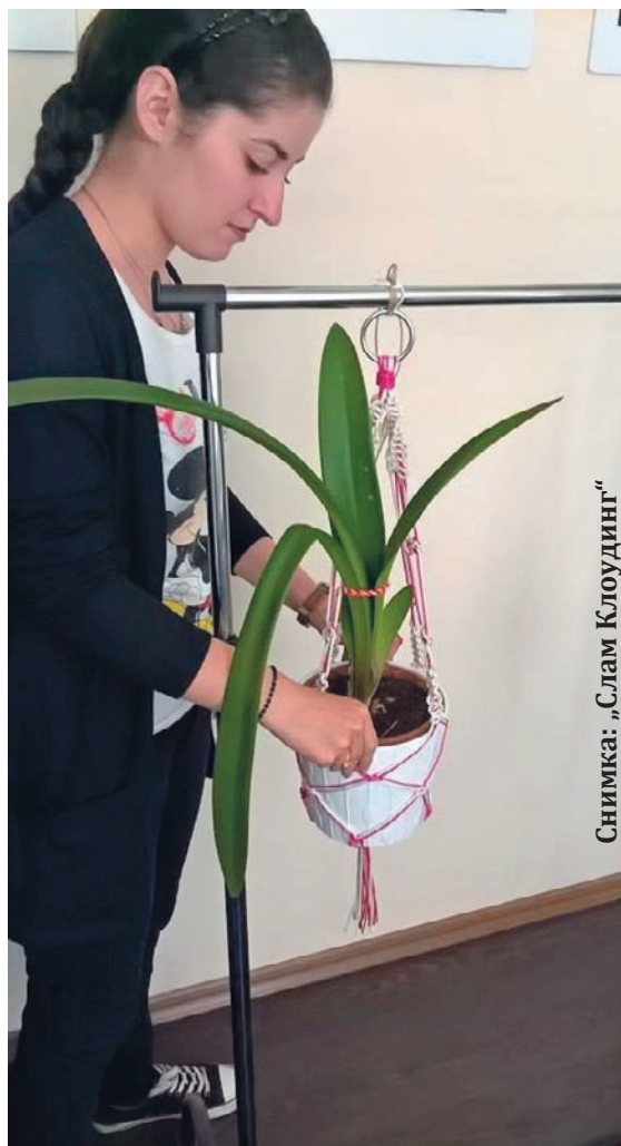
Снимка: „Слам Клоудинг“