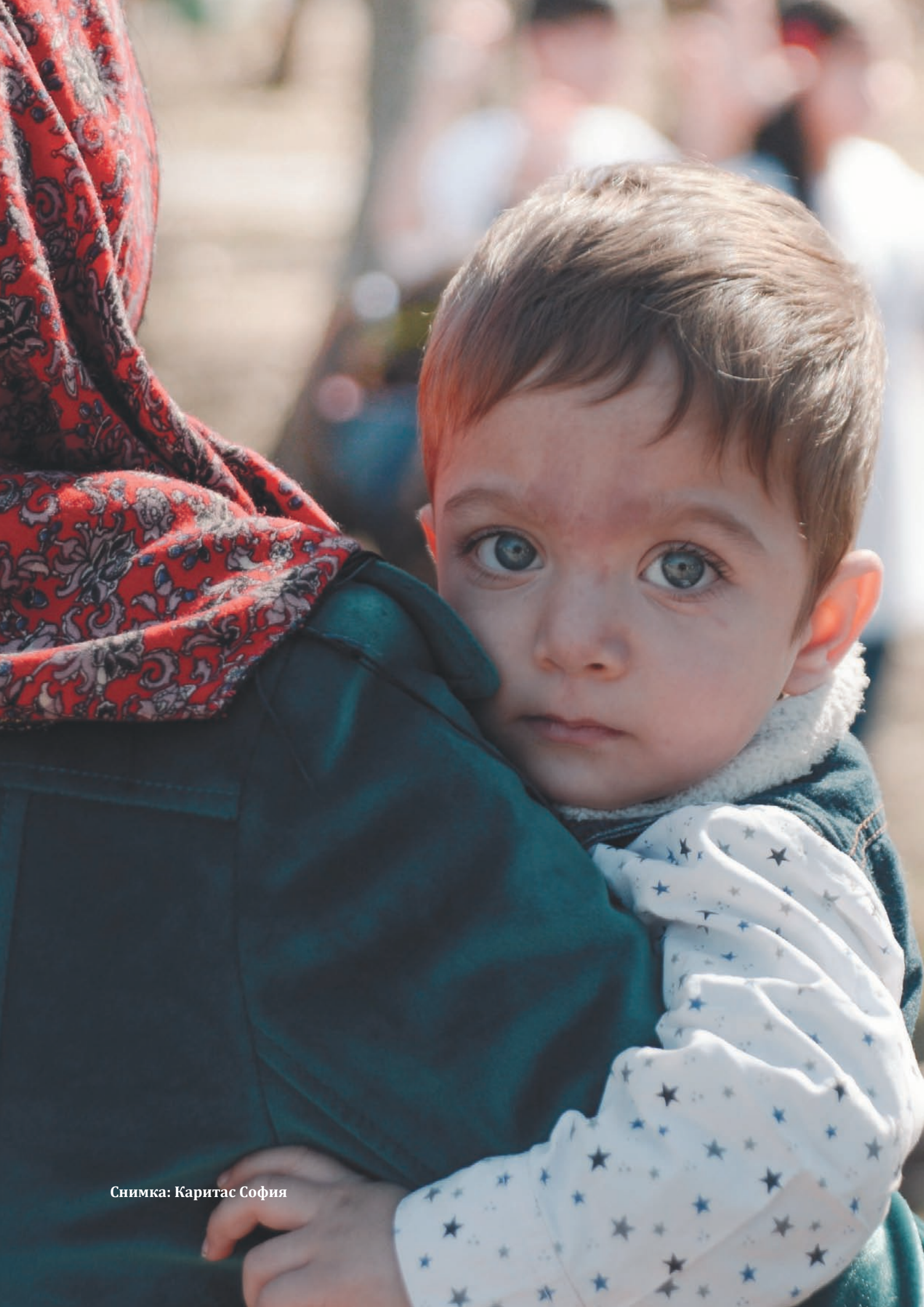
Снимка: Каритас София