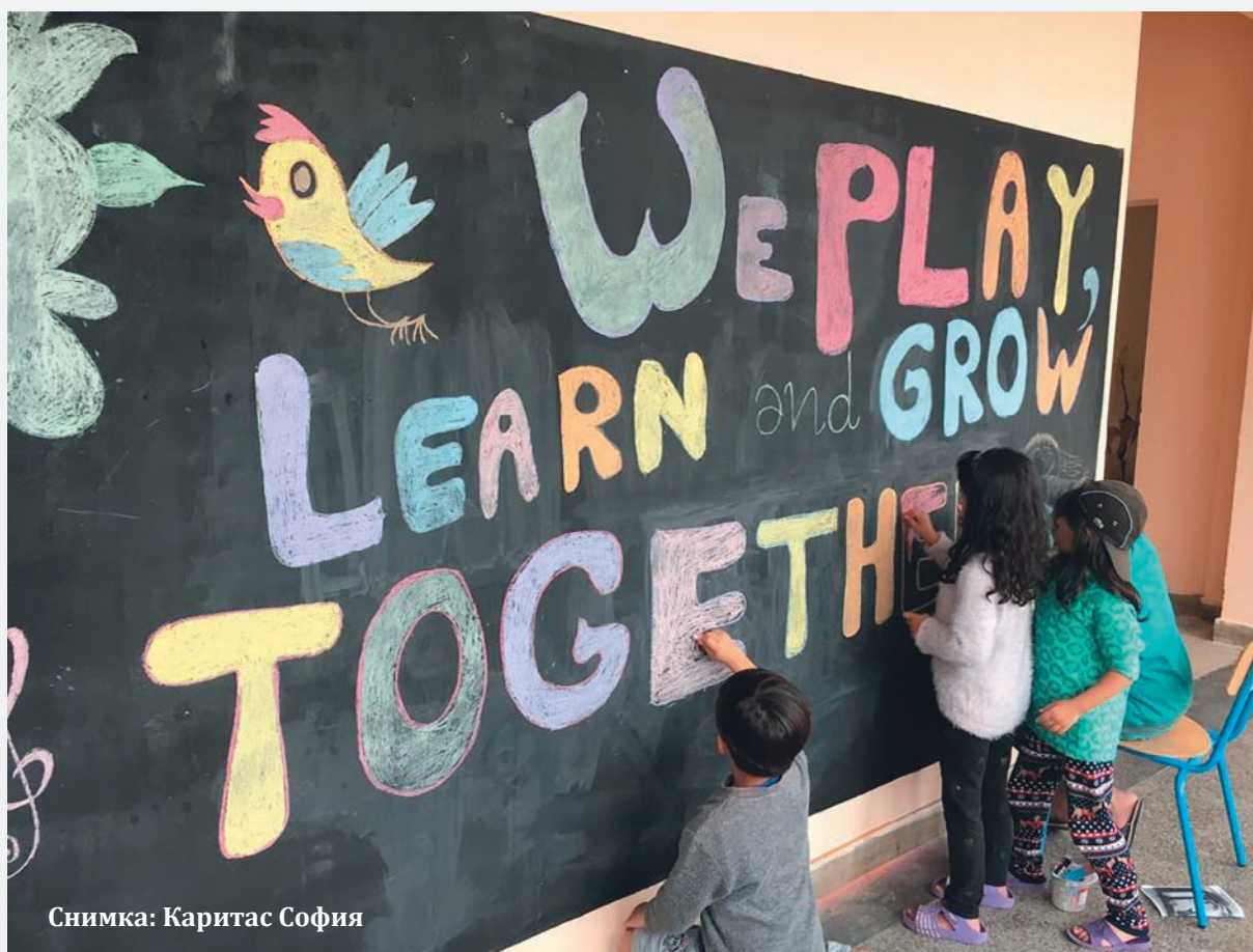
Снимка: Каритас София

Източник: авторът по данни на БНБ „Парични преводи от емигранти“